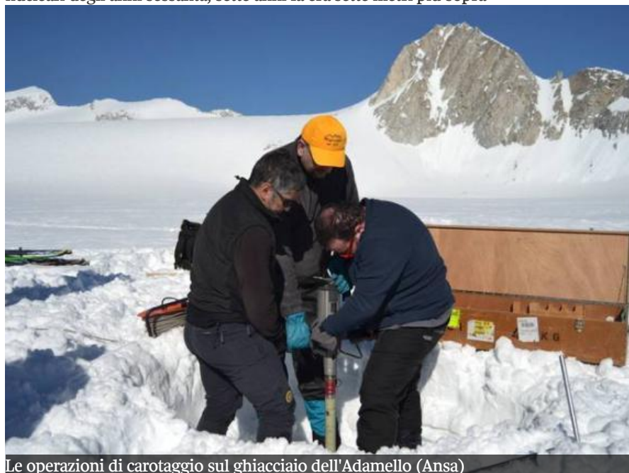
Le operazioni di carotaggio sul ghiacciaio dell'Adamello

E a 23 metri della carota di ghiaccio estratta dai ricercatori si trova il trizio dei test nucleari degli anni sessanta, sette anni fa era sette metri più sopra